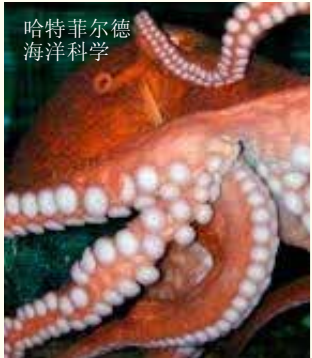
哈特菲尔德 海洋科学