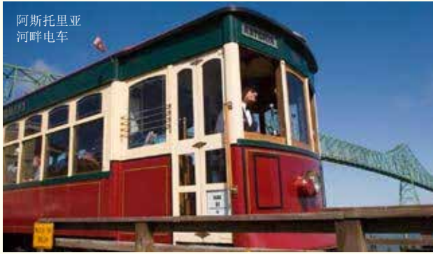
阿斯托里亚 河畔电车