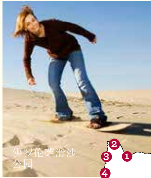
佛罗伦萨滑沙 公园