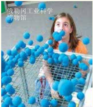
俄勒冈工业科学 博物馆