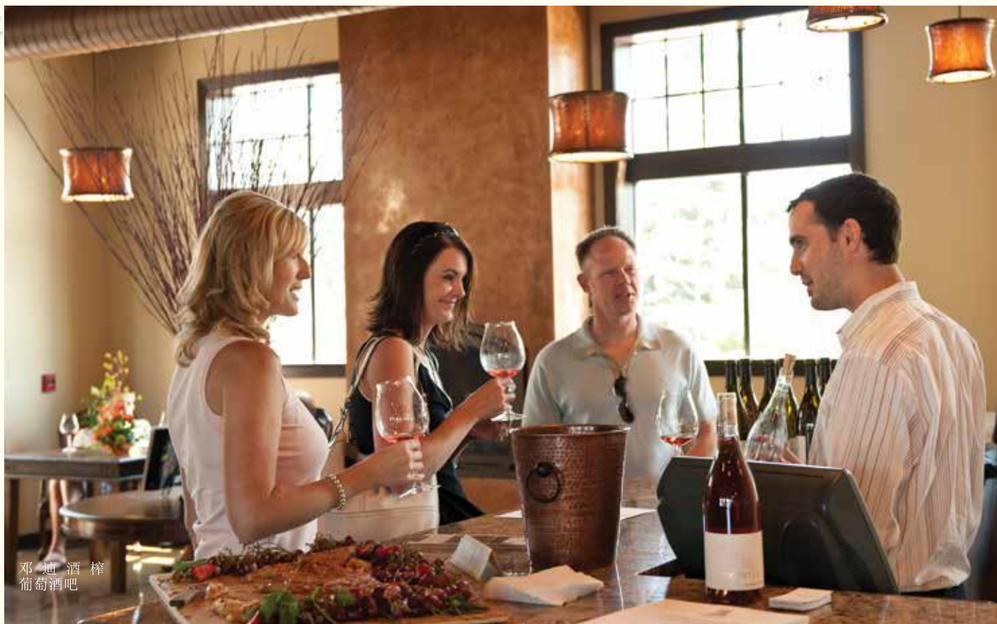
邓迪酒庄 葡萄酒吧